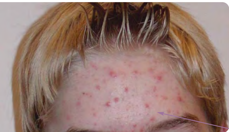
L'acne manifesta la massima insorgenza nell'età adolescenziale

Attenzione, però, perché queste creme per la notte, spesso consigliate dal dermatologo o dal farmacista, hanno un piccolo svantaggio: impoveriscono il film idrolipidico della pelle. In questo caso riveste particolare importanza l'utilizzo, poi alla mattina, della crema idratante per ripristinare la normale funzione della barriera cutanea.