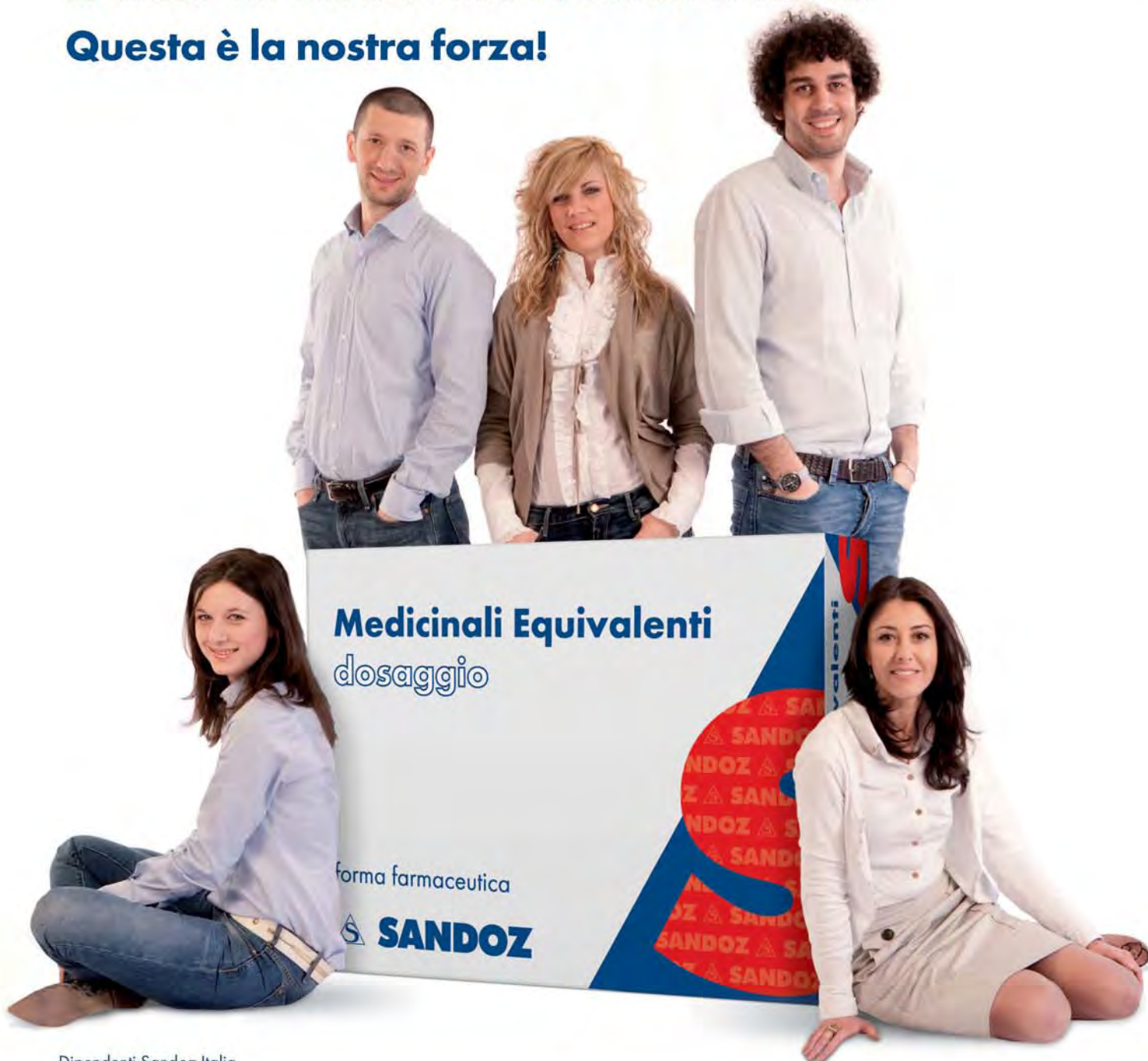
Dipendenti Sandoz Italia

Lo direste che abbiamo oltre 100 anni di storia? Questa è la nostra forza!