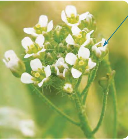
La borsa del pastore

definirla una "erbaccia infestante" è la borsa del pastore , Capsella bursa-pastoris . Appartiene alla stessa famiglia della senape, del cavolo, delle verze, delle rape.