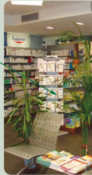
Una vista dell'interno con la zona riservata all'attesa

Il ventaglio dell'offerta è molto ampio: farmaci allopatrici, omeopatici, veterinari, integratori fitoterapici, prodotti per l'infanzia, dermocosmetici, articoli sanitari e apparecchi elettromedicali.