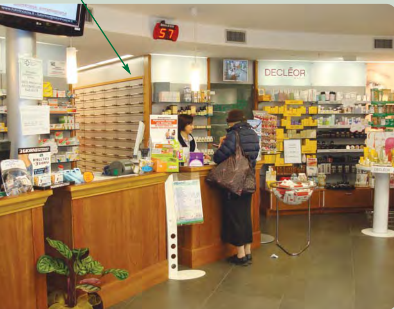
La zona banco vendita della Farmacia Comunale 25

Ben collegata con i vari punti della città grazie ai numerosi mezzi pubblici che si fermano davanti, usufruisce pure della vicinanza alla Metropolitana (che a breve arriverà fino al Lingotto). Visto l'orario particolare e la centralità del servizio, in farmacia si è resa necessaria la presenza di sei laureati e di un magazziniere. Il personale, anche se giovane, è altamente qualificato e sempre attento a offrire consigli appropriati in ogni circostanza.