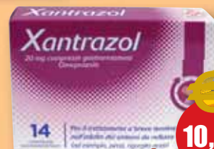
14 compresse da 20 mg