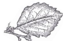
Hamamelis Virginiana WITCH HAZEL

Conosciuta come "l'arbusto delle streghe" è una vera pianta magica, originaria del nord America. Possiede importanti attività decongestionanti e vasocostrittrici riconosciute anche dalla scienza moderna e per questo iscritta nella farmacopea USA.