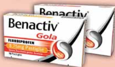
BENACTIV GOLA 8,75 MG Pastiglie aroma Limone e Miele Pastiglie Senza Zucchero aroma Arancia Flurbiprofene