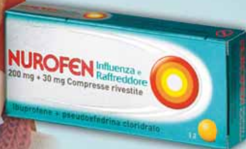
NUROFEN INFLUENZA E RAFFREDDORE 200 mg + 30 mg Compresse Rivestite Ibuprofene + pseudoefedrina cloridrato