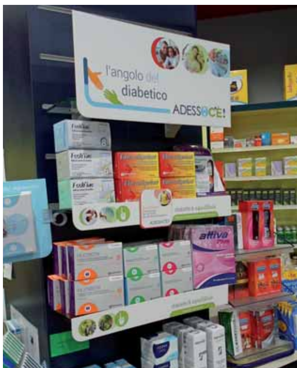
L'iniziativa “L'Angolo del Diabetico” prevede, nelle farmacie aderenti, lo svolgimento di giornate informative dedicate ai pazienti con diabete incentrate sulla prevenzione e la gestione delle complicanze del diabete

(*) vedere articolo dell'Associazione a pag. 39