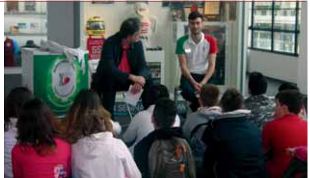
Gli studenti incontrano il paratleta Andrea Macri.

La sede del Museo, lo Stadio Olimpico, arricchisce e rende ancora più emozionante la visita: è possibile, grazie a un apposito tour, scoprire quelle "stanze segrete" che allo spettatore della partite sono vietate. Il visitatore viene accompagnato a bordocampo , alle panchine e negli spogliatoi , in tribuna stampa e tribuna d'onore . Palcoscenico dei Giochi Olimpici e Paralimpici Invernali 2006 ospita la più alta fiaccola olimpica d'Europa (ideata da Pininfarina)