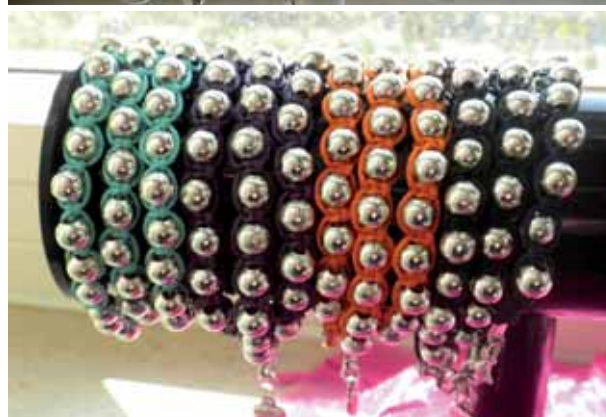
Alcune creazioni tra eleganza e armonia di colori