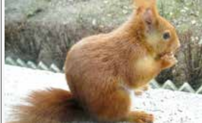
Berny: un roditore per amico