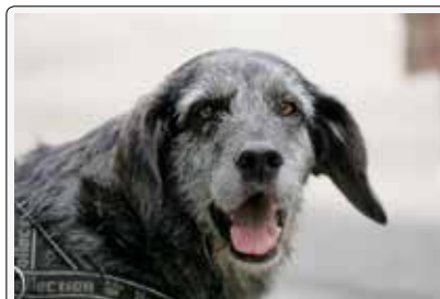
Giacomino: libero dal canile grazie a internet