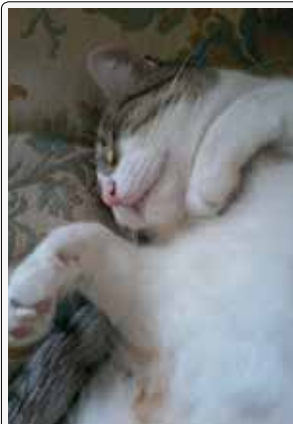
Io sto comodo così