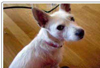
Birba: un amore nonostante il nome