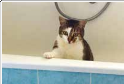
Dolly: l'igiene è tutto