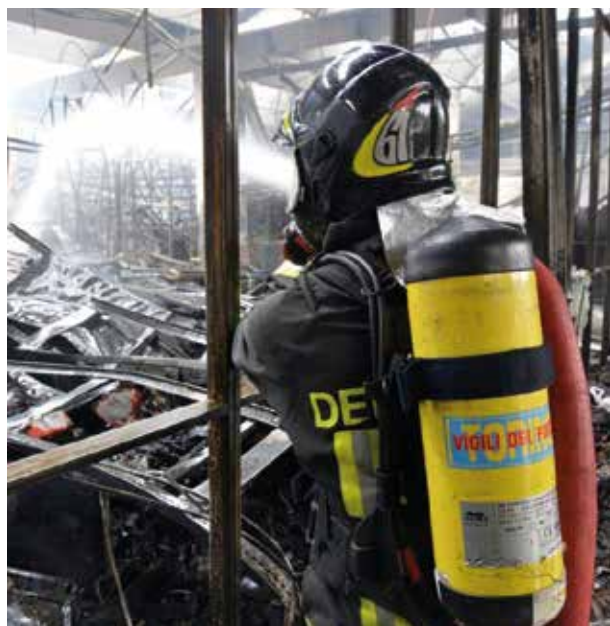
Archivio Comando VF Torino