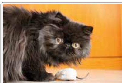
Coffie: ma il topino è finto!