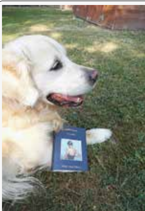
Argo: cosa è meglio di un buon libro?