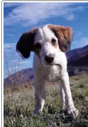
Dai, andiamo a passeggiare