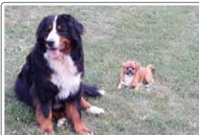
La strana coppia