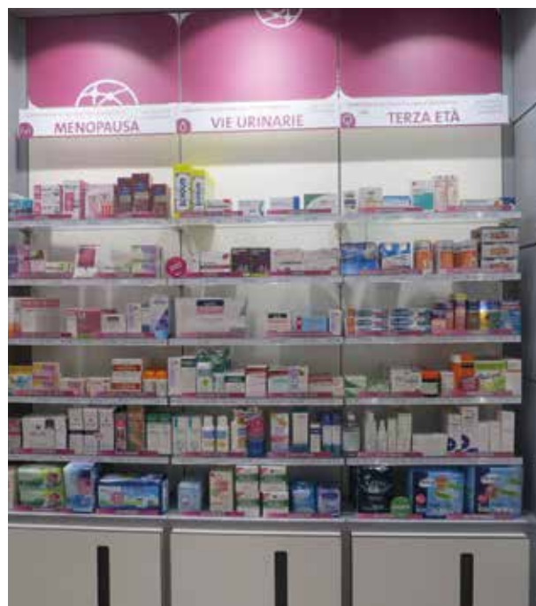
La comunicazione all'interno della farmacia focalizza l'attenzione sulle esigenze.

macia seguendo l'attività dei volontari dell'Associazione durante alcuni momenti di quella giornata. L'accoglienza della persona è un passaggio fondamentale che viene svolto da una delle volon-