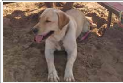
Bello stare alla spiaggia... ma all'ombra