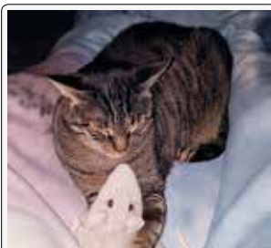
Minu' e il suo amico topo