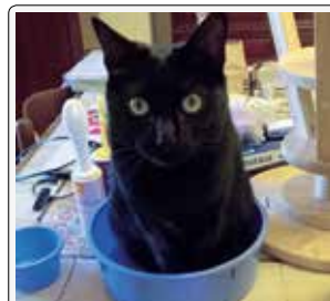
Merlino: nessun problema, mi sistemo ovunque