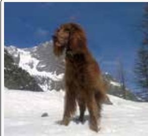
Etoile: dall'altezza dei miei anni...