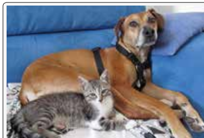
Gauss e Luna: amici inseparabili