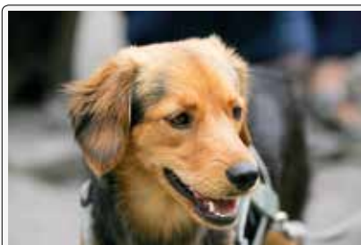
Emi: un sorriso che mette il buon umore