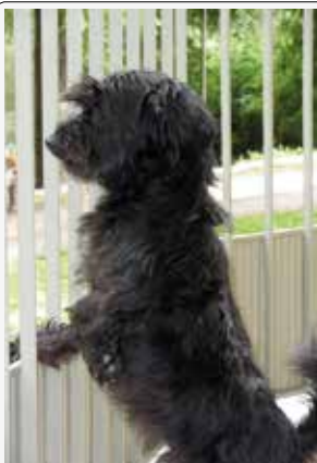
Ecco: guarda che ti ho visto!