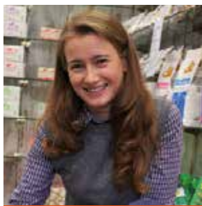
di Elisabetta Farina