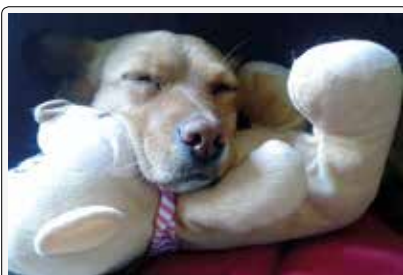
Ambra: Che morbido. Faccio un pisolino

Una carrellata delle bellissime immagini della mostra alla comunale 21. Grazie a tutti di avere partecipato!