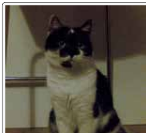
Sono in posa. Scattate pure la foto