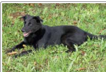
Nerone: il nero mi dona