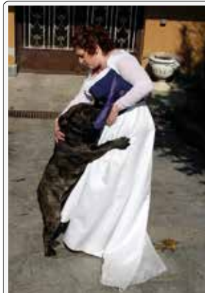
Un abbraccio alla sposa!