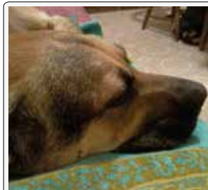
E ora un bel sonnellino...