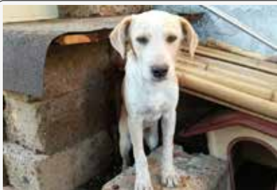
Che cosa aspetti a farmi le coccole?