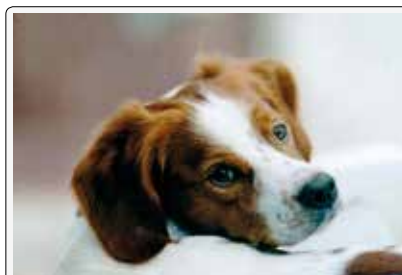
Balto: il fascino dello sguardo languido