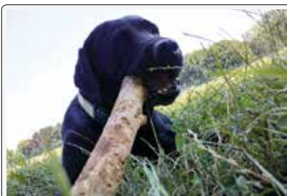
Daria: ecco il mio bastoncino interdentale