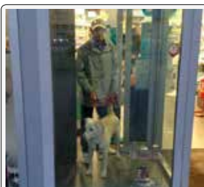
Balu: Oh, sono finito in vetrina