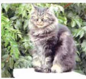
She: l'età non altera la bellezza