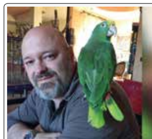
Un amico di verde vestito