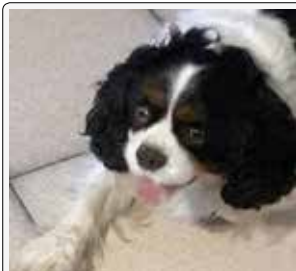
Ciao! Ci sono anche io