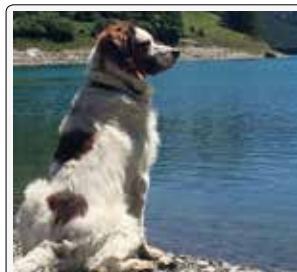
Che pace qui in montagna...