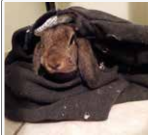
Avevo un po' freddo