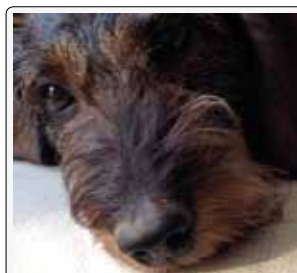
Un primo piano, grazie