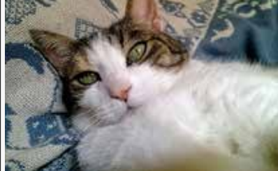
Nocciolina: ora vi ipnotizzo