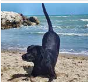
Akita: allora, giochiamo a beach volley?