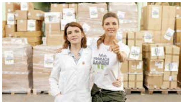
Anche quest'anno Martina Colombari sarà testimonial della campagna.

Tra le varie iniziative di raccolta e solidarietà alle quali l'azienda Farmacie Comunali di Torino aderisce quest'anno vi è anche la giornata promossa dalla Fondazione Francesca Rava In farmacia per i bambini , che si terrà lunedì 20 novembre .