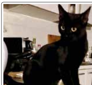
Dea: a me piace cucinare